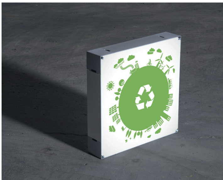
Vægssystemets paneler er fremstillet af genanvendeligt plastmateriale fra bl.a. gamle drikkeflasker. Det alternative materiale er meget holdbart og både lydabsorberende, brandhæmmende og Økotex-certificeret.

I Roomy prøver vi at efterleve det nyeste tiltag inden for den cikulære økonomiske tankegang (se figur s. 02). Bl.a. er alle Roomy Walls delkomponenter adskillelige. Dvs. at ved slitage eller skader kan alle delkomponenter bestilles som reservedele, så produktet ikke skal kasseres, hvis noget går i stykker.